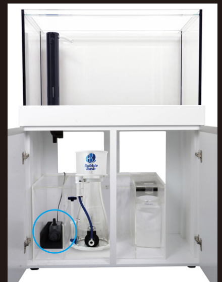
設置例 (ORCA-T90、サブSPに設置)